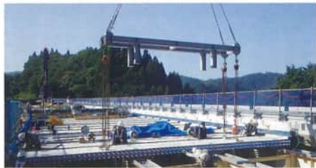
プレストレストコンクリート床版架設

損傷した鉄筋コンクリート床版を、より耐久性の高い床版に取り替えます。 (プレストレストコンクリート床版)