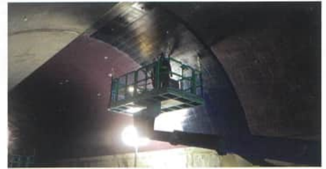
炭素繊維シート貼付